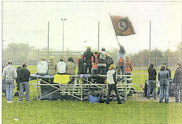
Mit 48 Gästen ist die «Haupttribüne» ausgebuht.