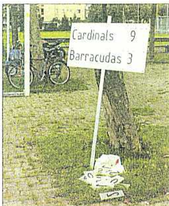
Das Verdict: Die Hauptstädter sind Meister.

... wenn angesichts der allgemeinen Speichelproduktion selbst Alex Frei und Francesco Totti die Spuke wegbleiben würde.