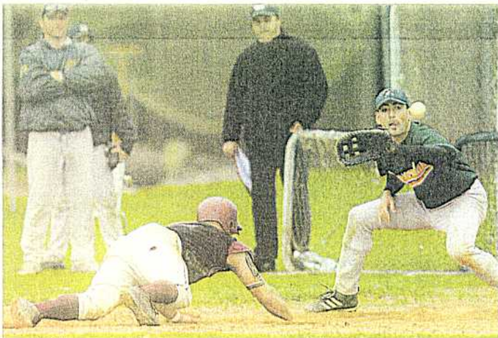
...totaler Einsatz an der Base...